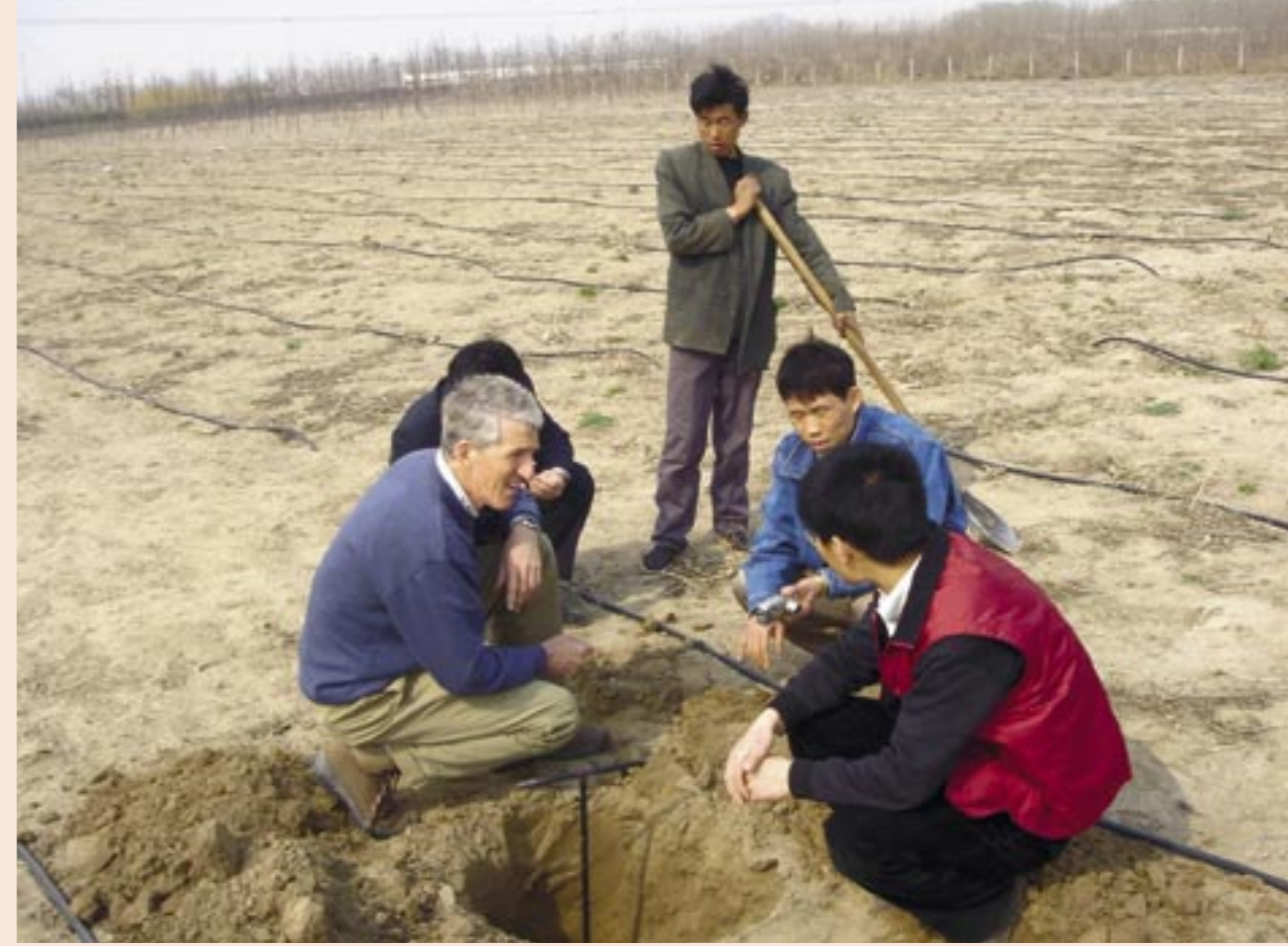
Een medewerker van Arcadis neemt grondmonsters. Onder meer op basis van het bodemonderzoek is het te gebruiken sortiment vastgesteld.

Beiden zien de toekomst zonnig tegemoet. Wei Qi: „Er is een grote behoefte aan landschapsarchitecten in China, zeker in de zich snel ontwikkelende steden. De overheid realiseert zich dat groen en milieu heel belangrijk zijn. Tot nu toe waren landschapsarchitecten vooral bezig met het maken van mooie ontwerpen maar nu gaan we steeds vaker een laagje dieper; we onderzoeken de potentie van flora, fauna, bodem en water. Veel internationale bedrijven hebben interesse in China, ze zien in het land een grote klant. Onze internationale werkervaring zal ons zeker van pas komen.” ■