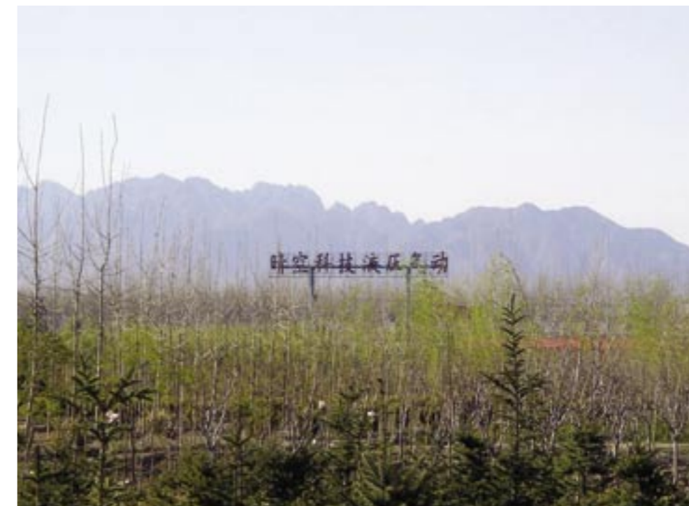
Het Holland Park ligt in een gebied met boomkwekerijen. Het park is zo ontworpen dat het zicht op de bergen behouden blijft.

Holland Park ligt aan de 6 e Ringweg. Dat is