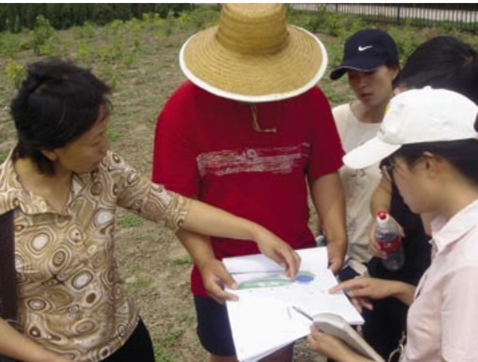
Ter plekke wordt het inrichtingsplan besproken, hier met Chinese studenten en tuinenlandschapsarchitecten.

in het Holland Park neer te zetten. Als concessie zijn er in de kinderspeelplaats wél oud-Hollandse spelletjes te doen zoals kaatsen en zaklopen.