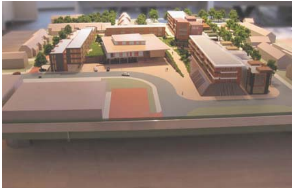
Maquette van Nieuw Geesterhage met zicht op de ingang van het Kulturhuis

Hieronder zijn de sterke punten en de risico's op een rijtje gezet. De sterke punten (getekend in bijlage 1) worden vooral genoemd zodat ze geborgd kunnen worden. Voor de diverse genoemde risico's (bijlage 2) worden in hoofdstuk 4 alternatieven en maatregelen voorgesteld.