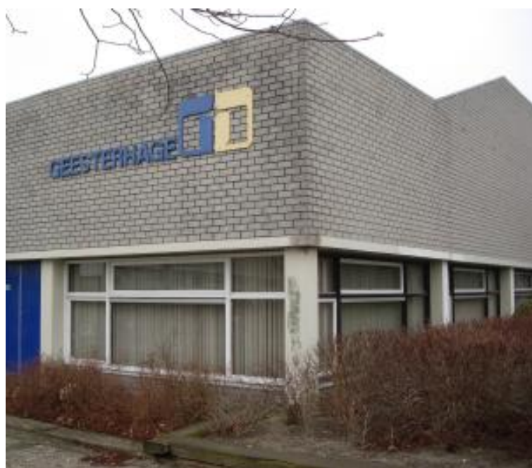
Het huidige ontmoetingscentrum Geesterhage

In winkelcentrum Geesterduin waren in het verleden enkele problemen maar sinds een vijftal winkelverboden voor jongeren zijn ingegaan zijn de meldingen tot nul gedaald.