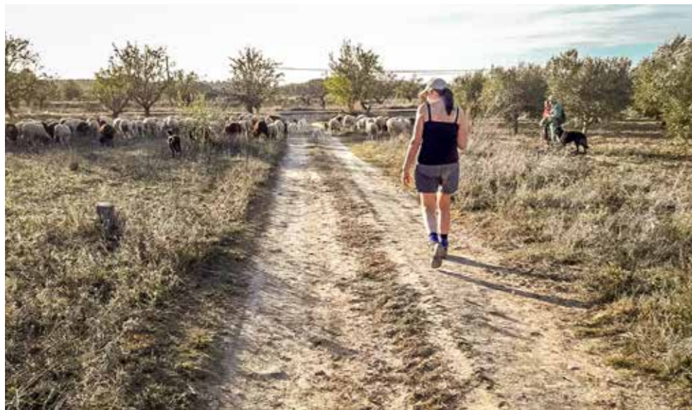
^ We besluiten nog een dagje te wandelen in de buurt van Casas Cuendra.

Na circa 17 kilometer bereiken we tegen zonsopgang Pension Isla, een piepklein huisje omringd door ingestorte huizen en afgebladderde muren. We twijfelen even of we wel goed zitten, maar binnen wacht ons een allerhartelijkste ontvangst door een ouder echtpaar, dat de stad heeft ingeruild voor de rust en ruimte van het platteland en in dit verlaten gehuchtje eigenhandig enkele oude panden aan het opknappen is. In onze kamer wacht ons een tweede verrassing: een privé vierpersoonsjacuzzi met uitzicht op de omringende heuvels. De laatste verrassing is dat de eigenaresse best een maaltje voor ons wil koken, dus de noodvoorraad pinda's en mueslirepen kan nog even in de rugzak blijven. Omdat het zo aangenaam is in de bubbels en daarna bij de houtkachel besluiten we een extra nachtje te blijven en de volgende dag in de omgeving te gaan wandelen. Op de kaart zien we een fascinerende, met