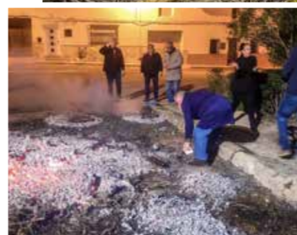
^ Dorpsbarbecue in La Portera.

In Valencia zag de Belgische volkszanger Eddy Wally ooit de sinaasappelen groeien in de gloeiend hete zon. Klinkt niet bepaald als het ideale wandelweer, maar op zo'n voorjaarsdag blijkt het achterland van deze Spaanse stad alles in huis te hebben voor een aangename wandeltocht.