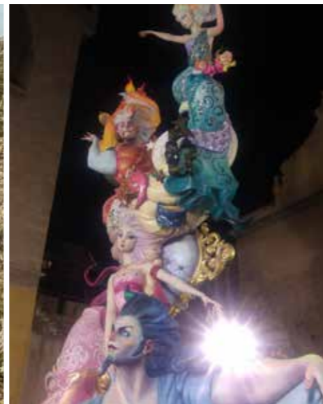
^ Las Fallas in Valencia.

La Portera. De route volgt makkelijke bergweggetjes en ter overbrugging stukjes rustig asfalt. Dit is zichtbaar een krimpgebied en we passeren tientallen verlaten huizen. Gelukkig vinden we in Campo Arcis een kruidenier die nog open is, zodat we lunch en avondeten kunnen inslaan, want in onze volgende stop, La Portera, zijn ook geen winkels.