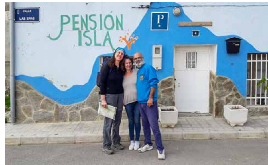
^ Het gezellige pension in Casas Cuendra.

In La Portera ontdekken we echter direct naast onze slaapplek wel een sociaal-cultureel centrum, waarvan de bar van 's ochtends vroeg tot 's avonds laat open is. Bovendien blijkt ook hier vanavond feest te zijn! Een groot deel van het dorpsplein wordt omgetoverd tot een reuzenbarbecue, waar iedere familie zijn portie vlees op legt. Wij krijgen een zak lamskoteletten en worstjes in de handen gedruwd om op de gigantische berg gloeiende kooltjes te leggen. Terwijl het zweet van ons voorhoofd druipt, lopen we met een gebutst pannetje met daarin ons geroosterde vlees terug naar het sociaal-cultureel centrum. Hier worden we als enige toeristen 'geadopteerd' door een lokale familie, die ons enthousiast volstopt met brood, vlees en natuurlijk de lokale wijn. Onderweg zagen we al de eindeloos uitgestrekte wijnvelden, waar druiven zich op de kalkrijke, stenige bodem te barsten groeien. Vanaf de Griekse overheersing wordt hier al wijnbouw bedreven. Tegenwoordig worden de wijngaarden geïrrigeerd en dat blijkt de productie ten goede te komen, want ongeveer een derde (!) van alle Spaanse wijn komt uit de buurt van Valencia. De belangrijkste rassen zijn de witte merseguera , de rode monastrell en van de rode bobal wordt een aardige rosé gemaakt. De regio is echter van oudsher vooral bekend om zijn vino licor moscatel . Lekker, maar eigenlijk geen echte