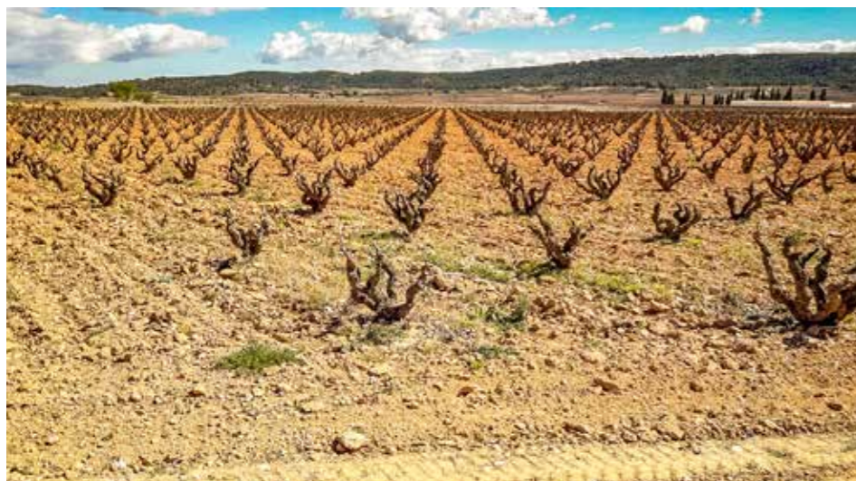
^ Sinds de Grieken wordt hier wijn verbouwd.

Van Casas de Cuadra lopen we de volgende dag door velden vol bloeiende amandelbomen en olijfbomgaarden naar